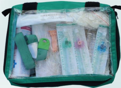
Infusionsset kpl. Im Etui