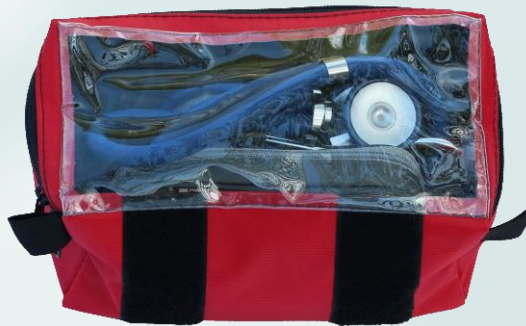
Diagnose – Set Etui kpl.