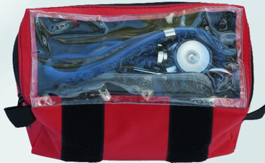
Diagnose – Set Etui kpl.